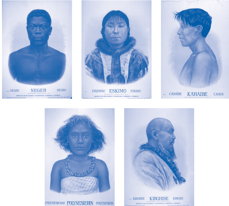
Wandplaten voor onderricht in de antropologie, etnografie en geografie, door W. von Steiner (naar foto van prof. dr. M. Futterer), ca. 1905, kleurenlithografie op papier, Tropenmuseum, Amsterdam.