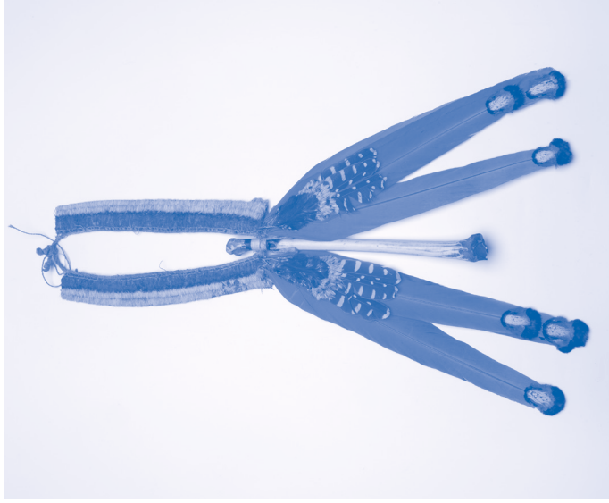
Ceremoniële borstversiering voor mannen (Wirahukang), Brazilië, ca. 1950. Been, katoen, veer. Museum Volkenkunde, Leiden.

Het Ka'apor volk uit het noordoostelijk Amazonegebied noemt zichzelf Ka'apor. Van oudsher worden deze mensen in onze literatuur en database echter Urubú genoemd, wat 'aasgieren' betekent. Deze naam kregen ze van hun Lusobraziliaanse vijanden, tegen het einde van de 19de eeuw. Hoewel de Ka'apor 'Urubú' als een negatieve benaming zien, wordt de term in de literatuur tot op heden gebruikt. Vrijwel alle volken uit het Amazonegebied staan voor vergelijkbare uitdagingen.