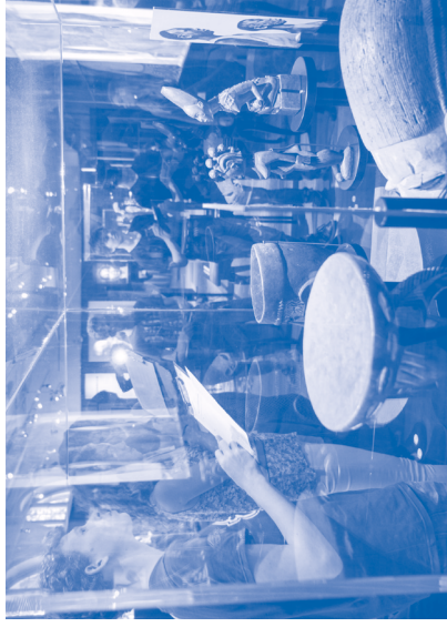
Rondleiding in het Tropenmuseum, 4 juni 2015

Binnen educatieve programma's gaat het niet alleen om woorden die gevoelig of discriminerend zijn, waarvan er meerdere in deze publicatie besproken worden. Soms kan de problematiek rondom taal veel subtieler en onverwacht zijn en wordt een doodgevoon woord gecompliceerd.