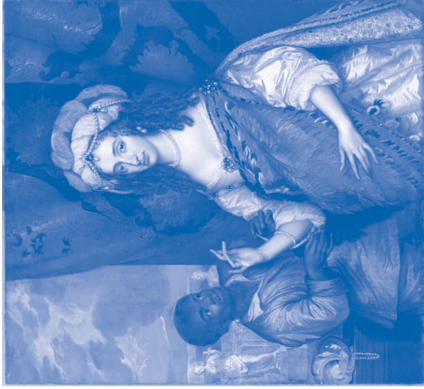
Adriaen Hanneman, Postuum portret van Maria I Stuart met een dienstdode , ca. 1664. Olieverf op doek. Mauritshuis, Den Haag.